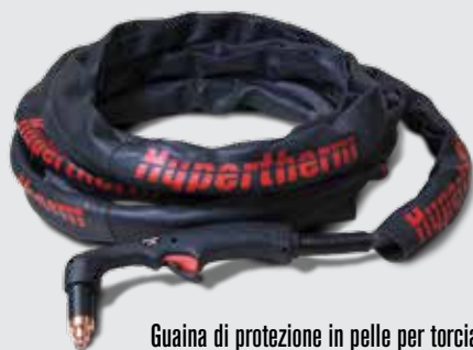
Guaina di protezione in pelle per torcia