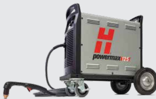
Kit carrello con ruote